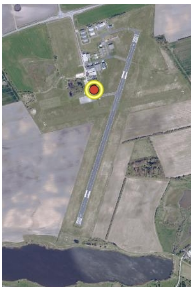
Figur 1 Oversigtskort over Kolding Lufthavn

En del af Kolding Lufthavn er omfattet af lokalplan nr.: 36.