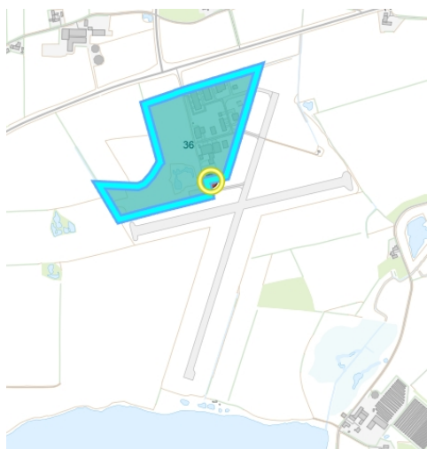
Figur 2 Oversigtskort (blå markering) der viser det lokalplanlagte område af flyvepladsen

Link til lokalplanen: Lokalplan nr. 36 (plandata.dk)