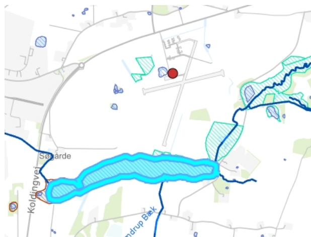
Figur 4 Oversigt over de nærmeste § 3 beskyttede naturområder, markeret med blå- og grøn skravering

Den nærmeste natur omfattet af naturbeskyttelseslovens § 3 ses på nedenstående kort: